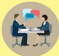
การสัมภาษณ์เชิงลึก (In - depth interview)