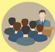
การอภิปรายกลุ่ม (Focus Group Discussion)

การวิจัยเชิงคุณภาพ (Qualitative Research)